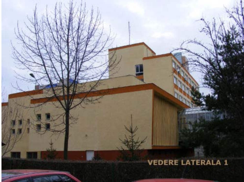
VEDERE LATERALA 1